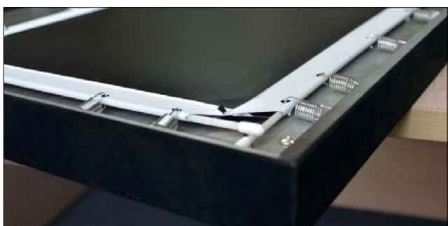
Запатентованная система натяжения