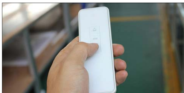
Опциональный пульт ДУ