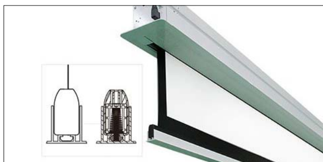
Гарантированно плотное закрытие