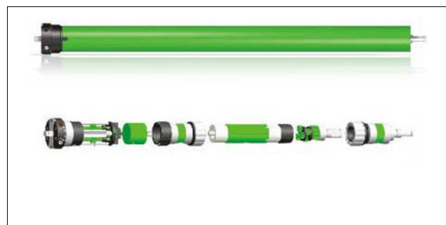
Тихий и быстрый мотор